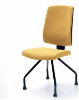
RAYA 23H CZARNY STOPKI