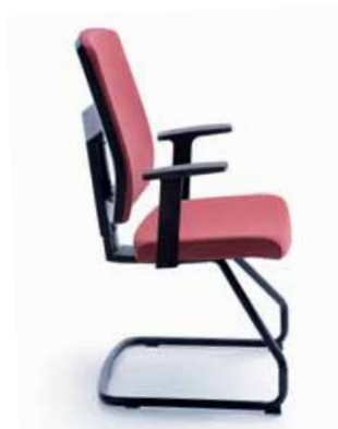
RAYA 21V CZARNY P46PU