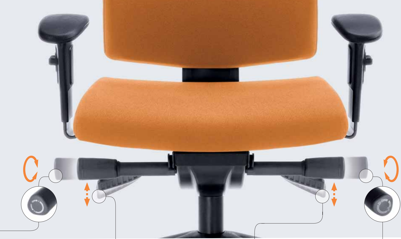
Regulacja wysokości siedziska Seat height adjustment