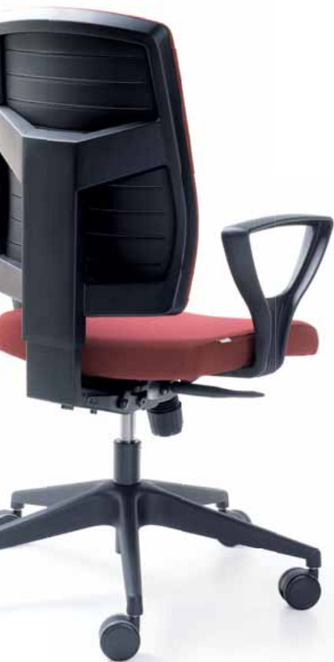
RAYA 21S CZARNY P52PA