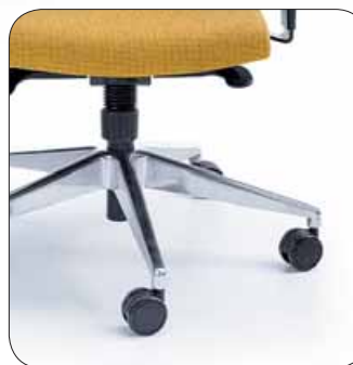
+Baza chrom +Base chrome