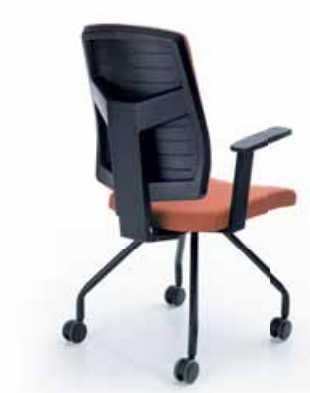
RAYA 21H CZARNY P46PU KÓLKA