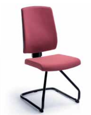
RAYA 21V CZARNY