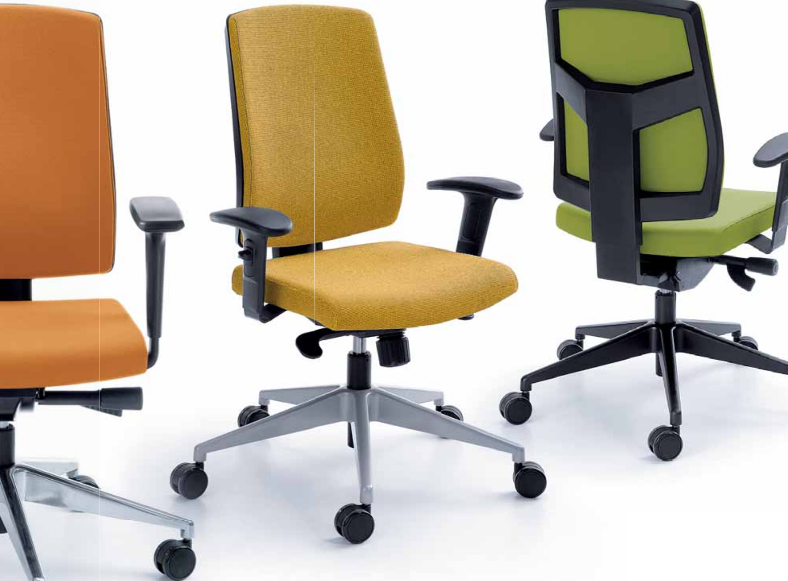
RAYA 23SL CZARNY P49PU