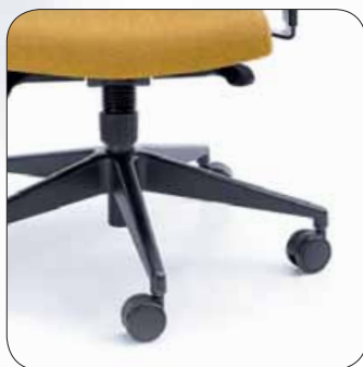
Baza standard Standard base