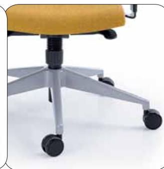
+Baza metalik +Base metallic