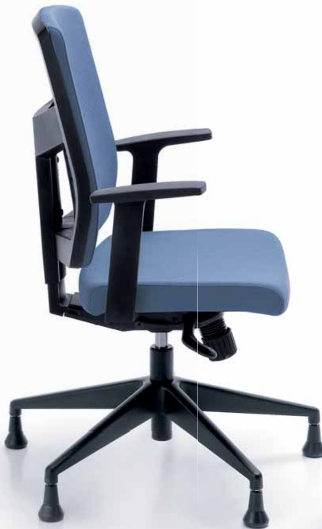
RAYA 21S CZARNY P46PU