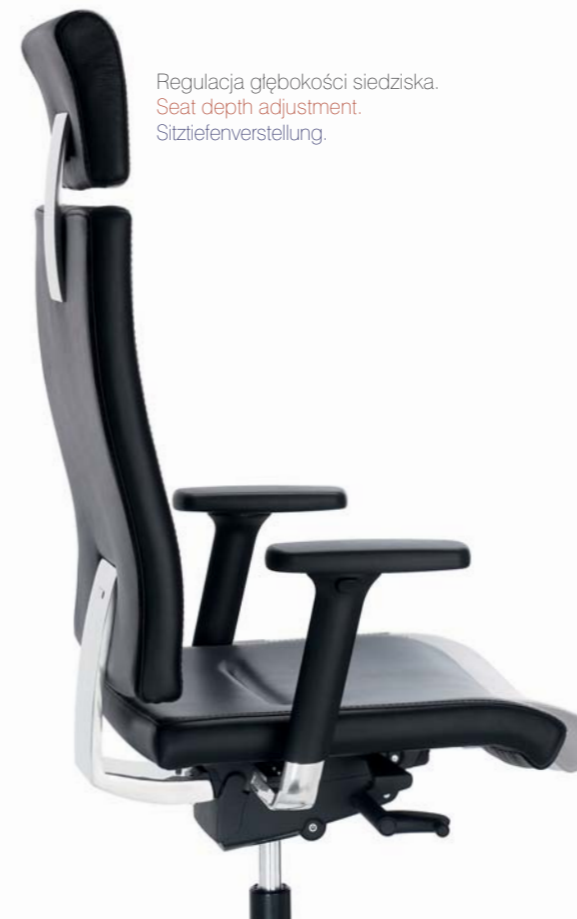
Regulacja głębokości siedziska. Seat depth adjustment. Sitztiefeinstellung.

Możliwość wykonania haftu wg wzoru klienta. Optional custom embroidery. Anfertigung von Stickereien nach Kundenmuster möglich.