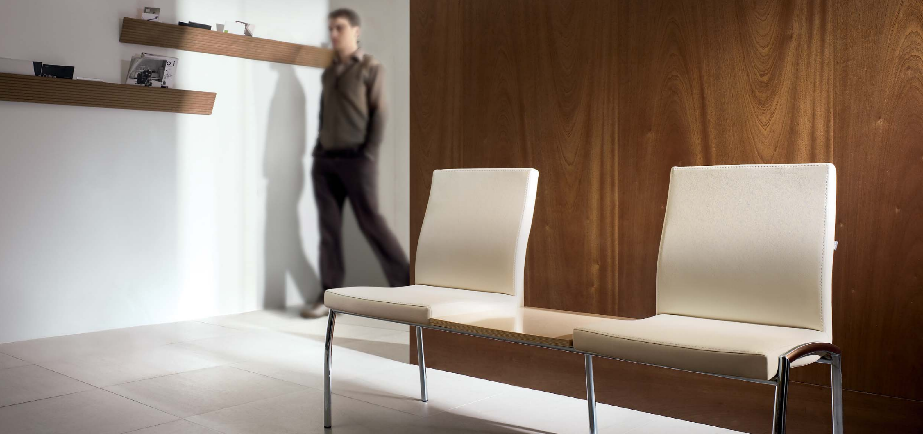
VT 423 B