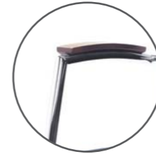
podłokietnik drewniany wooden armrest Armlehne aus Holz