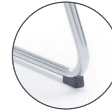
SK - ślizg na twarde podłoże - foot for hard floor - Kunststoffgleiter für harten Boden SF - ślizg na twarde podłoże z filcem - foot for hard floor with felt - Filzgleiter für harten Boden

Zrobiliśmy wszystko aby stworzyć dla Ciebie idealne warunki do rozmów i negocjacji. Zadbaliśmy o komfort i prostą, elegancką formę, teraz sukces jest w zasięgu Twojej ręki.