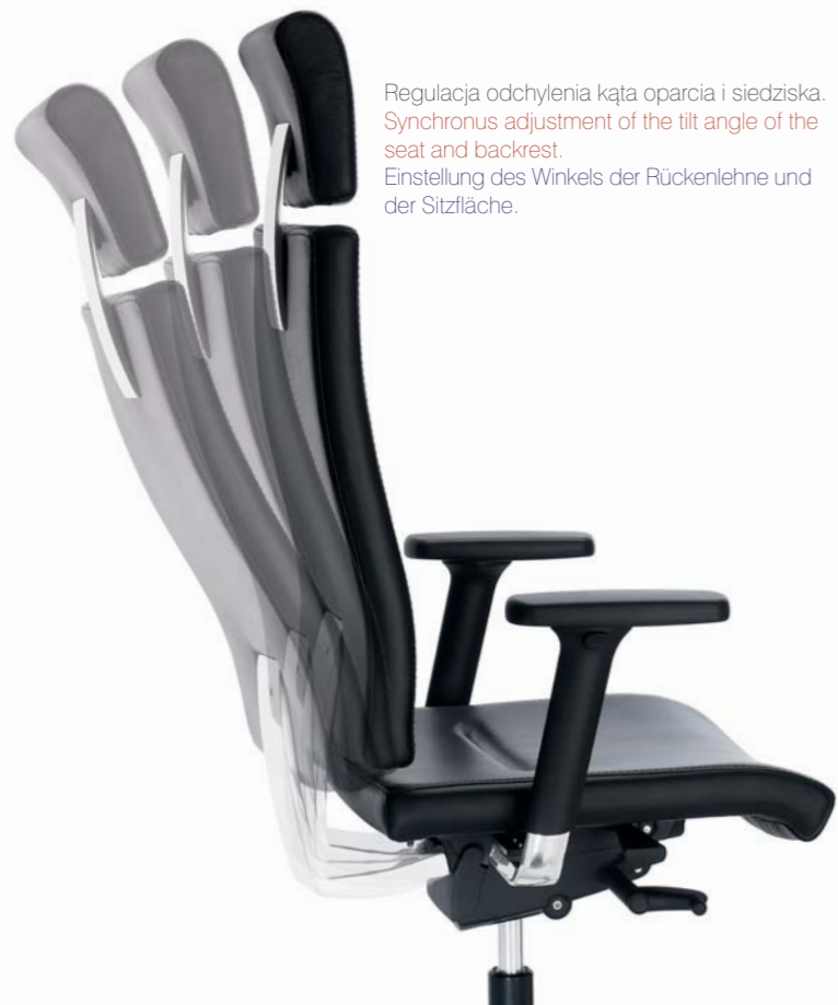
Regulacja odchylenia kąta oparcia i siedziska. Synchronous adjustment of the tilt angle of the seat and backrest. Einstellung des Winkels der Rückenlehne und der Sitzfläche.