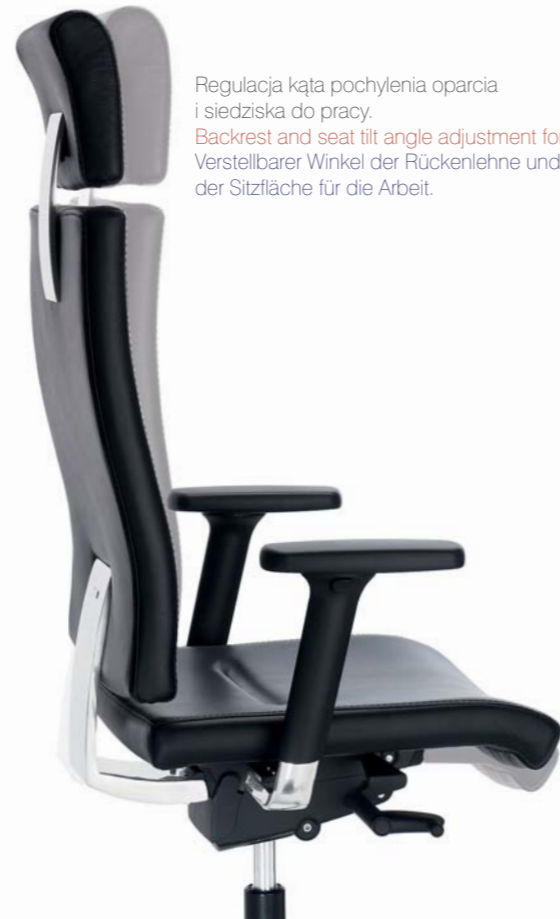
Regulacja kąta pochylecia oparcia i siedziska do pracy. Backrest and seat tilt angle adjustment for work. Verstellbarer Winkel der Rückenlehne und der Sitzfläche für die Arbeit.