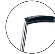
podłokietnik tapicerowany skórą armrest upholstered in leather Armlehne mit Lederpolsterung