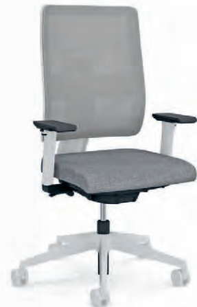
Telegrey plastic star base Kruisvoet kunststof telegrijs