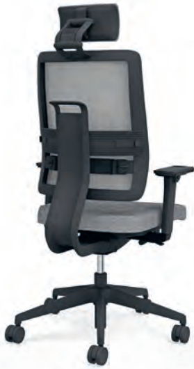
Black plastic star base Kruisvoet kunststof zwart