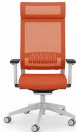
414.1200 + ls405-2 + al003 + ns410-xx