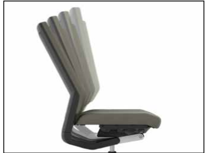
Arretierung der Rückenlehnung / Backrest tilt / Inclinaison du dossier / Blokkering rugleuning