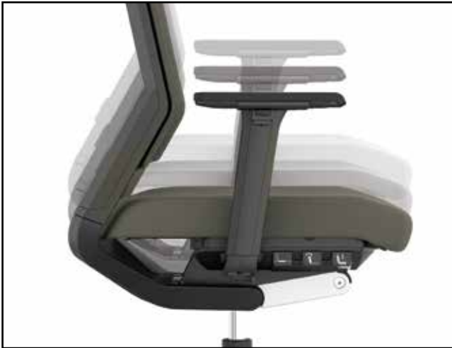
Sitzhöhe / Seat height / Hauteur d'assise / Zithoogteverstelling