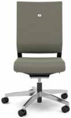
412.1000 + fk100-14