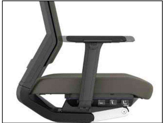
Armlehntiefe / Armrest depth / Profondeur des manchettes d'accoudoirs / Diepteverstelling armleuning