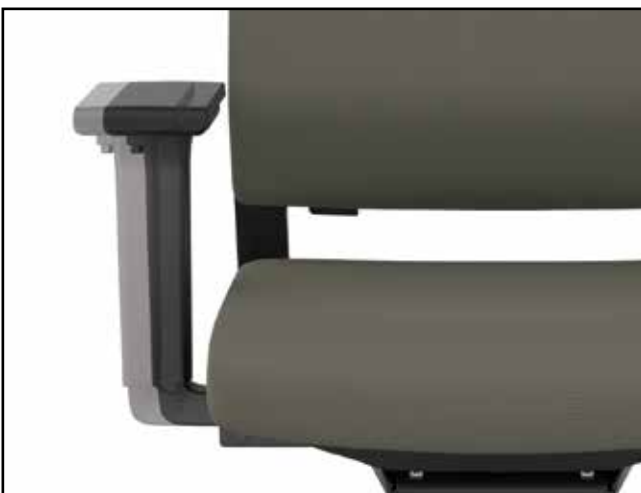
Armlehnenbreite / Armrest width / Largeur des accoudoirs / Breedteverstelling armleuning