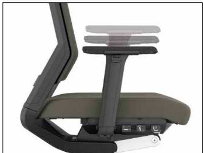
Armlehnenhöhe / Armrest height / Hauteur des accoudoirs / Hoogteverstelling armleuning