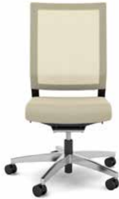
414.1000 + fk100-14