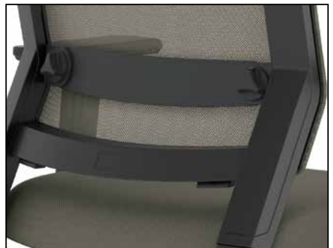
Lordosenverstellung / Lumbar adjustment / Ajustement du soutien lombaire / Lumbaalverstelling