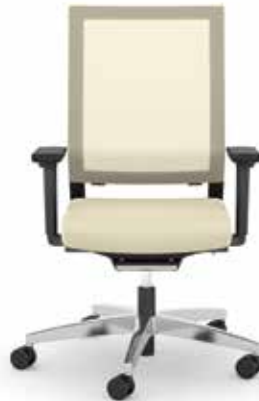
414.1010 + fk100-14 + al046-04