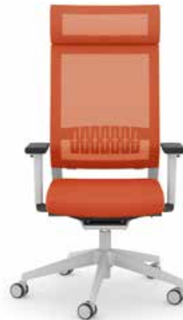
414.1200 + ls405-2 + al003 + ns410-xx