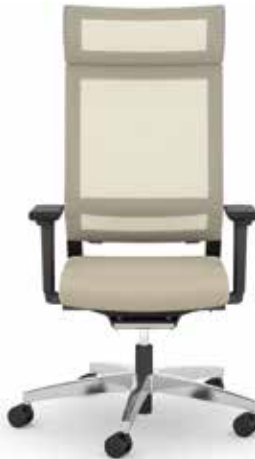
414.1010 + fk100-14 + ls407 + al046-04 + ns410-xx