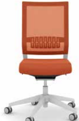
414.1200 + ls405-2