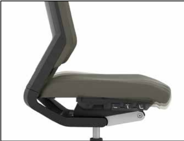
Sitzneigung / Seat tilt / Inclinaison d'assise / Zit-neigverstelling

Integrated function | Fonctions intégrées | Geïntegreerde functies