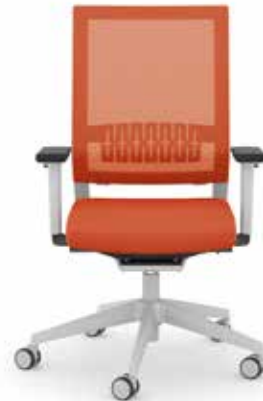
414.1200 + ls405-2 + al003