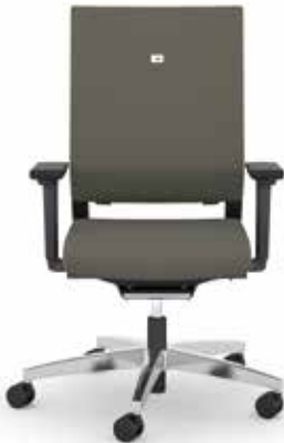
412.1010 + fk100-14 + al046-04