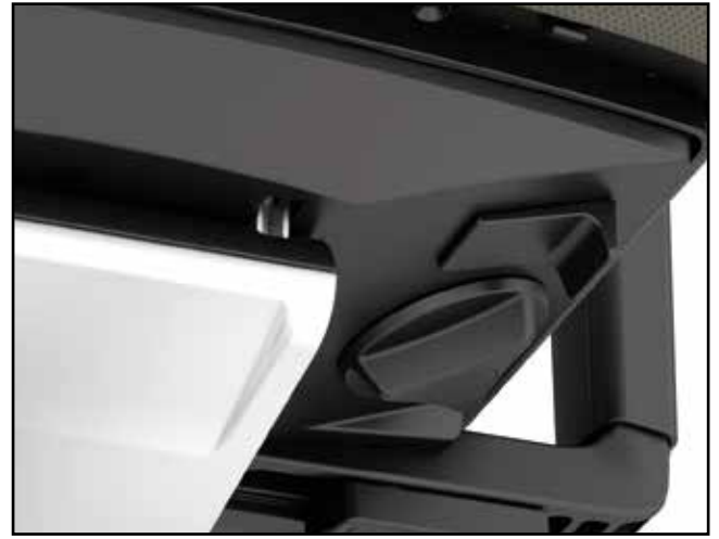
Federkrafteinstellung / Tension adjustment / Tension du dossier / Verstelling weerstand