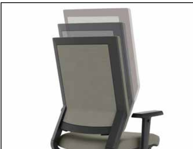
Rückenlehnenhöhe / Backrest height / Hauteur du dossier / Hoogteverstelling rugleuning