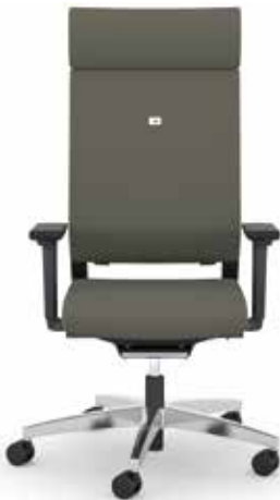
412.1010 + fk100-14 + al046-04 + ns401