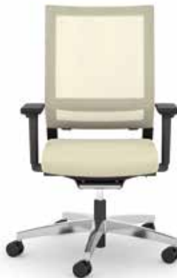
414.1010 + fk100-14 + ls407 + al046-04