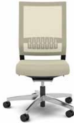
414.1000 + fk100-14 + ls405