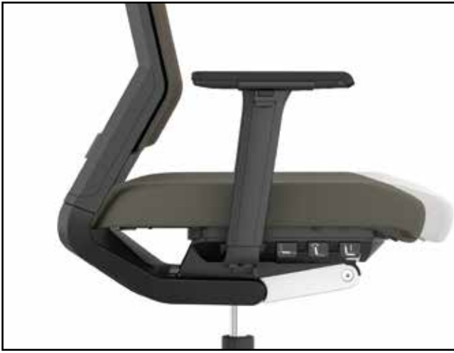
Sitztiefe / Seat depth / Profondeur d'assise / Zitdiepte verstelling