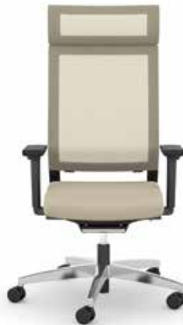
414.1010 + fk100-14 + al046-04 + ns410-xx