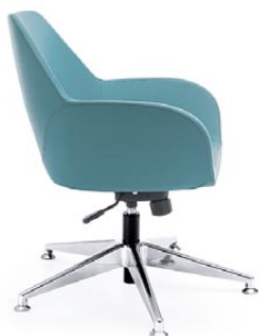
FAN 10T CHROM