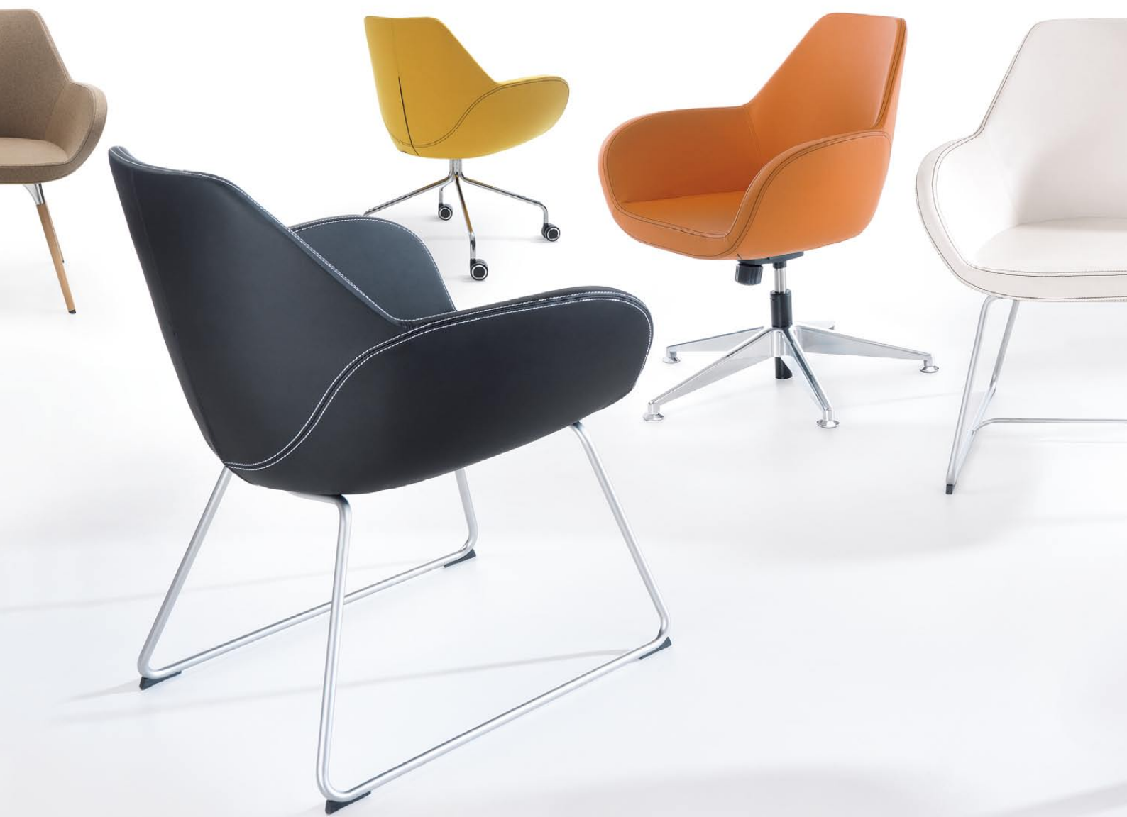
FAN 10HW WOOD