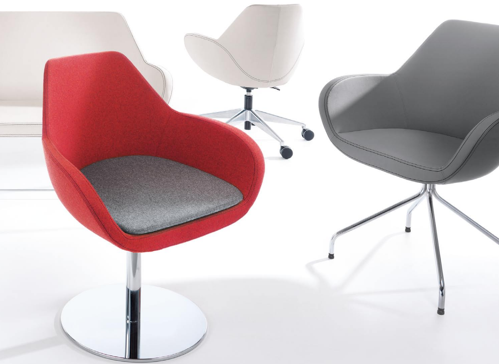
FAN 10R CHROM + poduszka