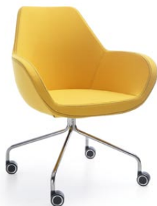
FAN 10HC CHROM