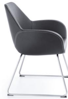
FAN 10V SATYNA