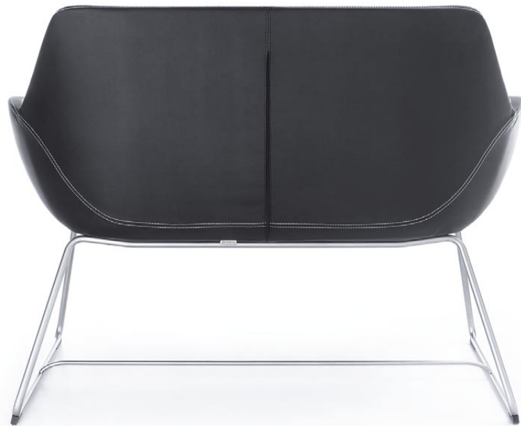
FAN 20V SATYNA