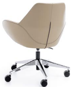
FAN 10E CHROM