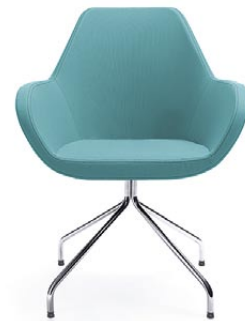
FAN 10H CHROM