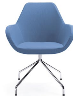
FAN 10HS CHROM