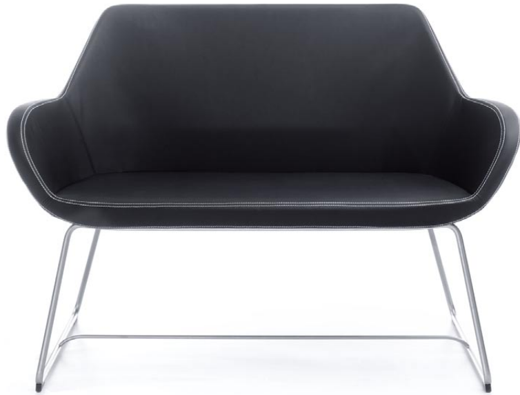
FAN 20V SATYNA