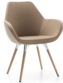
FAN 10HW WOOD