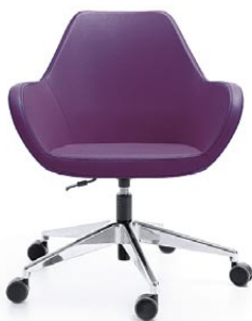
FAN 10E CHROM