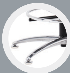
01 Krzyżak ze stopkami