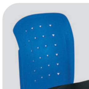
Oparcie z tworzywa w kolorze niebieskim (BL)