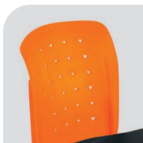
Oparcie z tworzywa w kolorze pomarańczowym (OR)