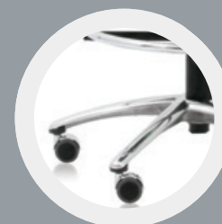
02 Krzyżak z rolkami samohamującymi pod obciążeniem (opcja RB)