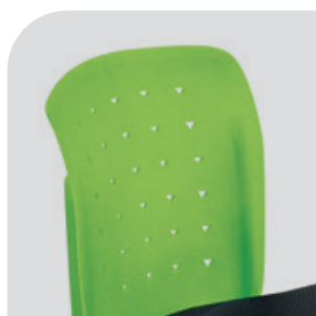
Oparcie z tworzywa w kolorze zielonym (GN)