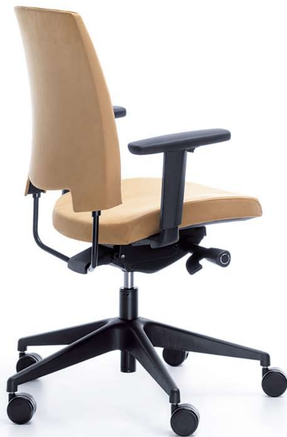
ARCA 21SL CZARNY P54PU