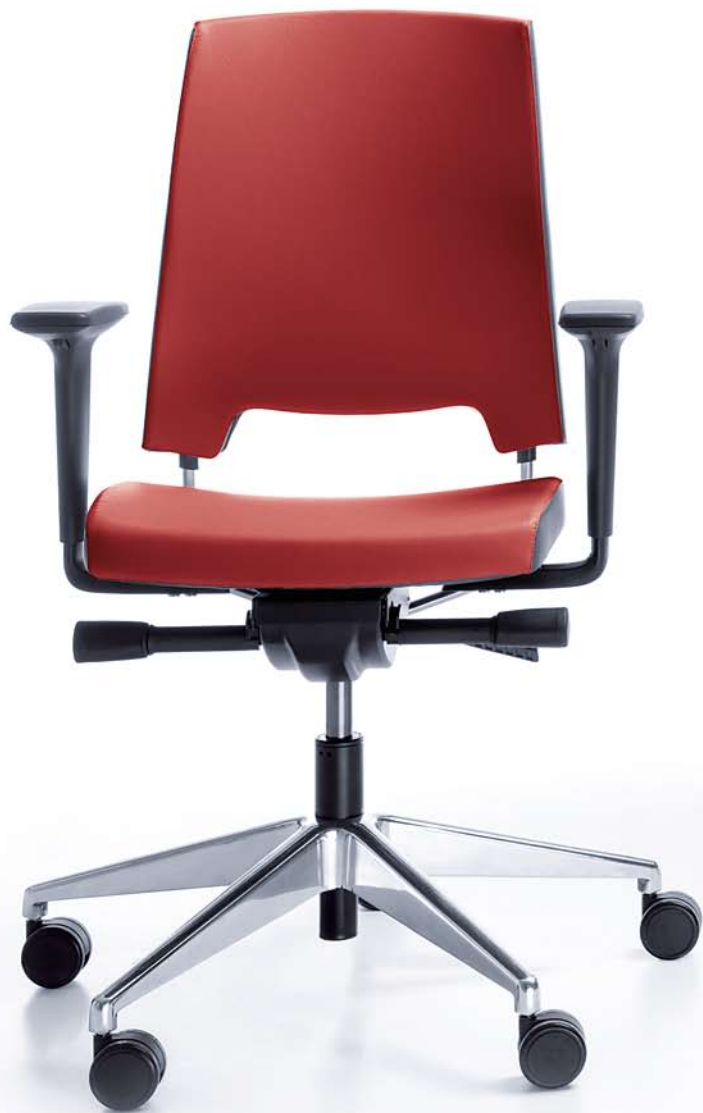
ARCA 21SL CHROM P51PU