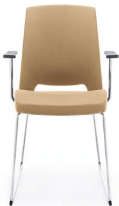
ARCA 21V CHROM PP