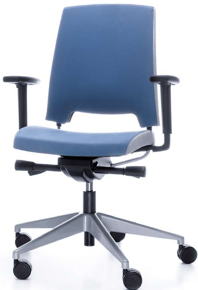
ARCA 21SL METALIK P54PU