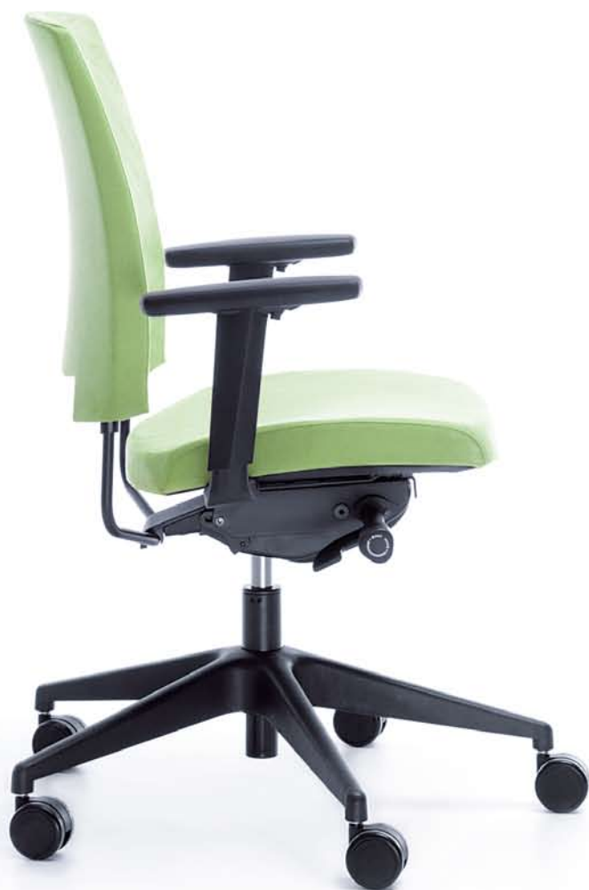
ARCA 21SL CZARNY P54PU