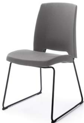
ARCA 21V CZARNY