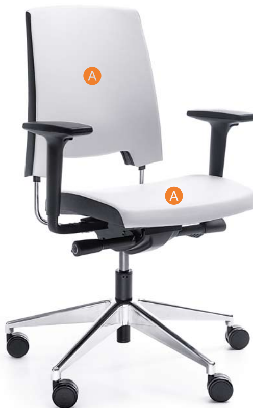
ARCA 21SL CHROM P51PU